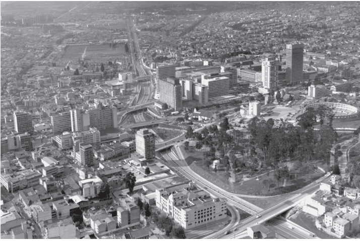
FOTO: SAÚL ORDÚZ, MUSEO DE BOGOTÁ, PANORÁMICA DE LA CALLE 26, CA. 1960

Este es también uno de los sectores que más se ha transformado en Bogotá a juzgar por los testimonios de varios bogotanos como el de Tiburcio Pantoja quien en 1843 destacaba de este lugar “la limpieza del cielo, la pureza del aire” y al que los ciudadanos de entonces acudían para “dejar atrás el estrépito y bullicio de la ciudad para reemplazarlo por el silencio y la calma, así como por el paisaje de la llanura de Bogotá que permitía a la distancia observar la ribera del río que hacia el occidente la limitaba” 2 . En un siglo y medio este idílico paisaje cambió por completo, como lo hicieron varios sectores más.