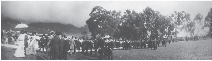
FOTO: ANÓNIMO. ARCHIVO: SMOB, JVOR (IV-241B), EL CAMPO DE LA MAGDALENA, 1912

Esta facultad, creada en 1936, permitió así mismo la formación de los primeros profesionales de la arquitectura en nuestro país que hasta entonces tenían que estudiar ingeniería para luego dedicarse a la arquitectura o simplemente estudiar en el exterior.